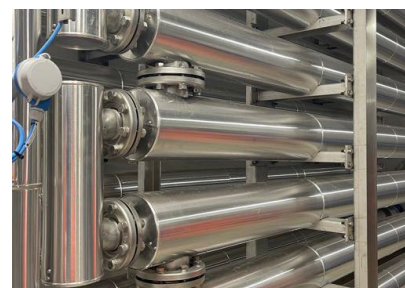
POMPES À CHALEUR

Pour la production de biométhane, un épurateur a été mis en place. Une étape clé, qui permet d'éliminer les impuretés grâce à l'utilisation de charbons actifs et de séparer, par un système de membrane, le CO 2 et le méthane.