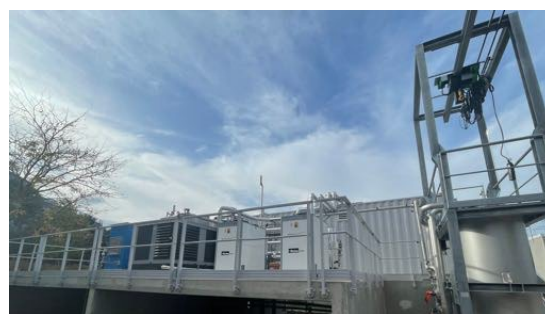
ÉPURATEUR DE BIOGAZ

Ce méthane, appelé alors biométhane, est dirigé vers le poste d'injection de GRDF, situé à proximité de l'épurateur. Il permet l'odorisation, le comptage et le contrôle du biométhane avant injection dans le réseau.